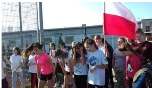
Do startu! Gotowi? Start!

Do udziału zostali zaproszeni wszyscy uczniowie od klas pierwszych SP po trzecie gimnazjum. Uczniowie zostali podzieleni na kilka kategorii oraz na dziewczęta i chłopców. Za miejsca I-III były medale, a oprócz tego każda klasa dostała słodki upominek.