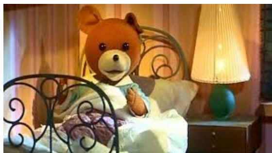
Nasz „polski” miś-Miś Uszatek., ale oglądany także w Finlandii, Holandii, Japonii oraz na Węgrzech.