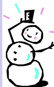
Pan Bałwan z wiersza Kasi

zaspasy są już obok drogi mróz się staje bardziej srogi bałwan na podwórzu stoi mała Basia już go stroi rękawiczki czapka szal i pan bałwan idzie w dal.